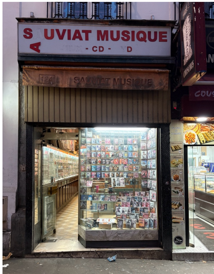
2. Devanture du disquaire Sauviat Musique, 18 e arrondissement