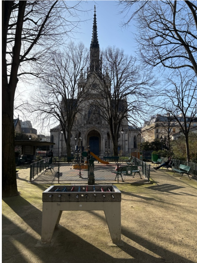
3. Vue sur l'église Saint Bernard de la Chapelle depuis le square Saint-Bernard-Saïd-Bouziri, 18 e arrondissement