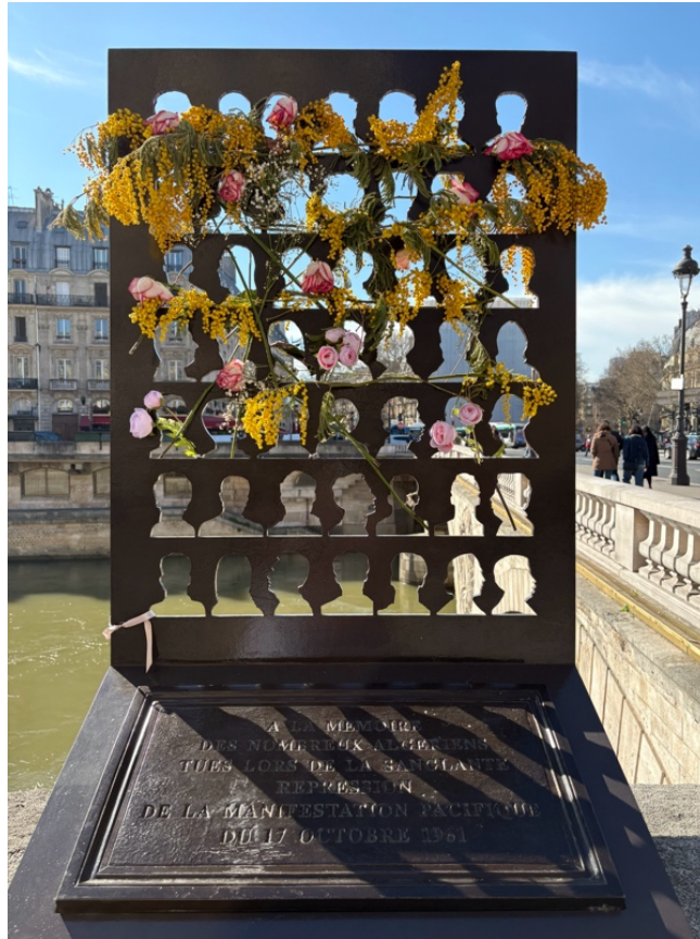
1. Stèle commémorative aux Algériens noyés le 17 octobre 1961, 4 e arrondissement (A.Lascaux, 2026)

comme Warda. Quant aux garnis 2 , ils disparaissent à partir de 1958 avec les grands projets de réhabilitation du quartier qui relèguent les classes populaires immigrées aux portes de Paris, mettant fin à la présence des Maghrébins dans le 5 e arrondissement.